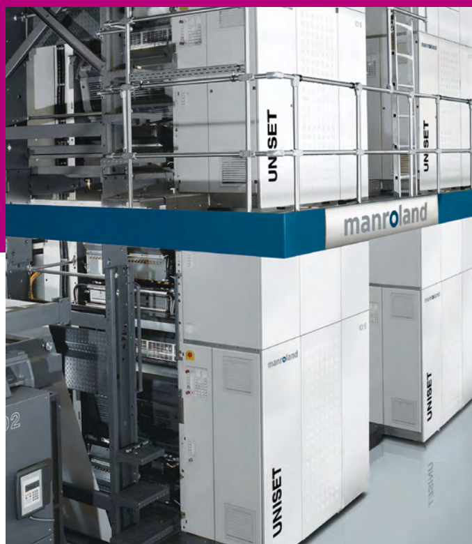
Variable web widths for a flexible UNISET. Variable Bahnbreiten für eine flexible UNISET.